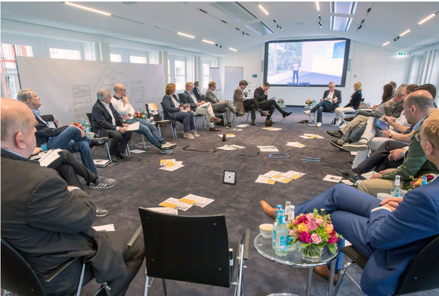
Forum Zukunftsmedizin im Mai 2019 in der HanseMerkur